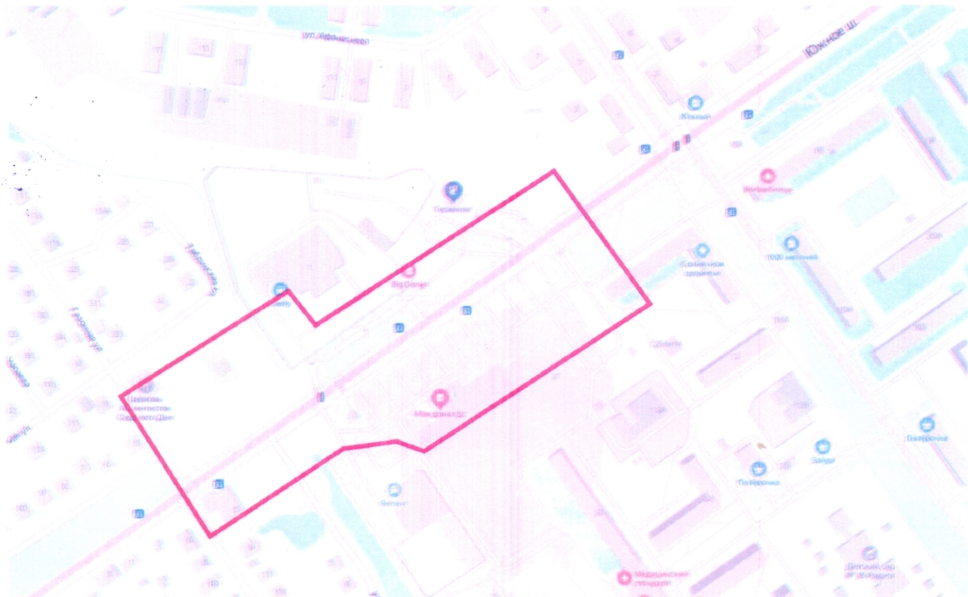
Схема границ подготовки проекта планировки и межевания территории